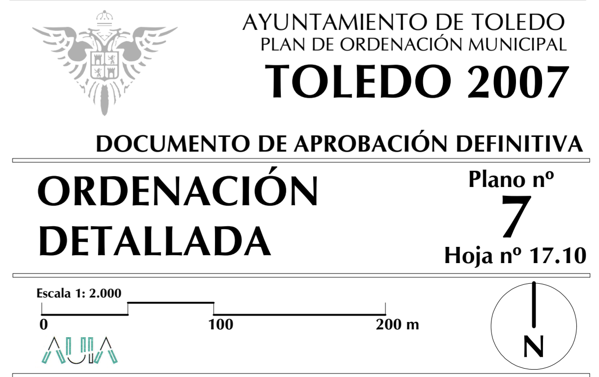
Localización sobre la cuadrícula 1:2000